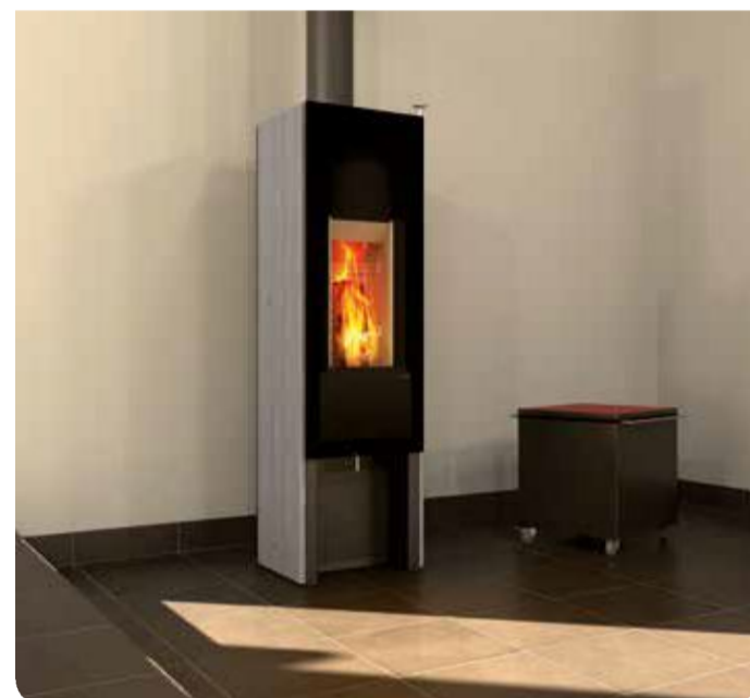
Design: GIANI Gabirella Vetsch, Andre Remens

Sie wollen eine platzsparende, aber dennoch elegante Lösung? Der T-ONE SWING besticht mit nach hinten gewölbten, aus gegossenem Stein geformten Seitenwänden. Durch die rahmenlose Glastür, bietet sich Ihnen ungetrübte Sicht auf das einmalige Flammenspiel der aufrecht platzierten Holzscheite. Geniessen Sie bereits kurz nach dem Anfeuern die erste wohlige Wärme, für einen gemütlichen Abend in Ihrem Zuhause.