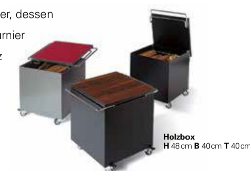
Holzbox H 45cm B 40cm T 40cm