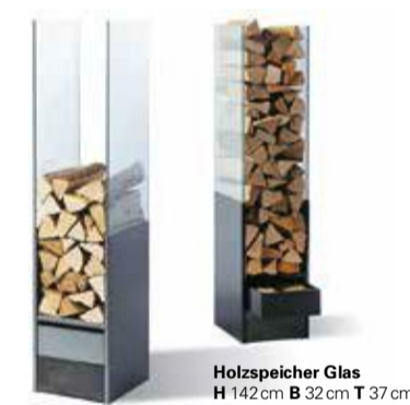
Holzspeicher Glas H 142cm B 32cm T 37cm

Wer sein Feuerholz lieber diskret lagert, für den ist die praktische Holzbox genau das Richtige. So kann man Holz und Kehrgarnitur in separaten Fächern verstauen und hat gleichzeitig einen dekorativen Hocker, dessen Deckel mit Holzfurnier oder farbigem Filz bezogen ist.