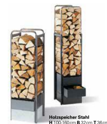
Holzspeicher Stahl H 100-100cm B 32cm T 36cm