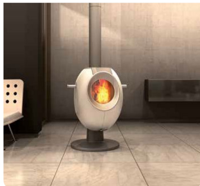
Design: GIANI Gabirella Vetsch, Andre Remens

Die kubische Form des T-ONE STONE bringt Ihnen unaufdringliche Eleganz, die gradlinige, schnörkellöse Glasfront modernen Glanz. Das „gewisse Etwas“ ist dabei ein besonderes Extra: Mit dem optionalen Backaufsatz wird der T-ONE STONE zum Gourmet-Ofen. Geniessen Sie so mit bereits einer Holzladung über sechs Stunden wohlige Strahlungswärme, und backen Sie dabei gleichzeitig Pizza, Kuchen, oder ein duftendes Brot!