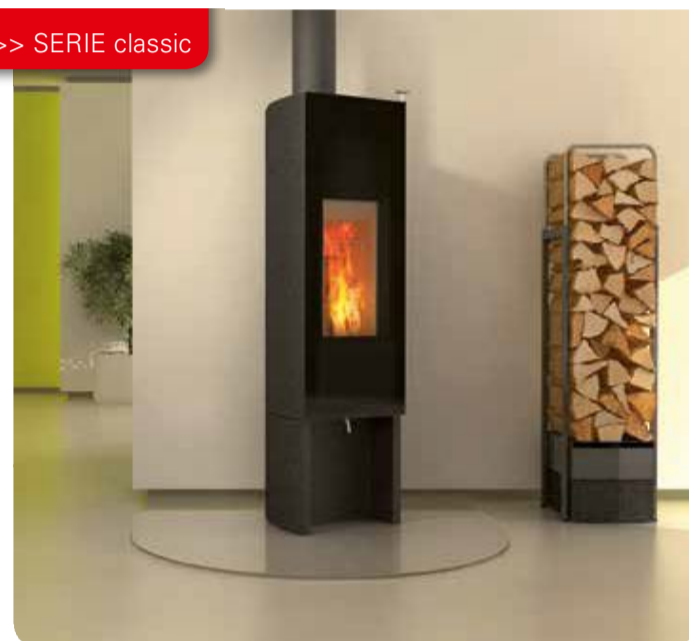
Design: GIANI Gabirella Vetsch, Andre Remens